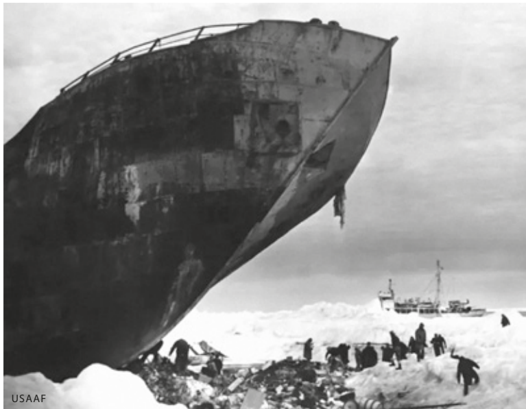
AEBetako armadak Groenlandia okupatu zuen Bigarren Mundu Gerran, alemaniarrek Danimarka okupatu ondoren.

Baina Groenlandiaren bidean beste eragile garrantzitsu bat agertu zen aspaldi: AEBak. Groenlandia erosteko Trumppek adierazitako asmoa ez da berria.