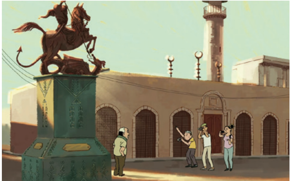
Filmeko bi fotograma. Animazio-irudiak nahasten dira elkarrizketa eta testigantzekin.

Ezinbesteko azpiegiturak eta zerbitzuak mantendu bai, baina urbanistikoki erabat aldatu zen hiria. Apropos, gainera. Haifa, Jaffa edo beste zenbait hiri palestinar okupatu ez bezala, Lyd –egungo Lod, Israelen mapan– guztiz bestelako hiri bat da urbanistikoki, dokumentalgileek bezala, hirigileek ere berresten dutenez. Guztia eraitsi zen. Are, Israeliek idatzirikiko historian, terminologia argigarria da: ez da Lyd hiriaren 1948ko gertakari hura okupazio gisa deskriba-