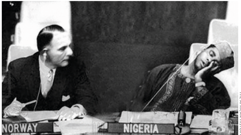
Jaja Wachuku Nigeriako ordezkaria 1960ko NBEko bilkura batean lo, itxuraz.

Independentziaren aldeko mugimenduan urtetan jardun ondoren, bera izan zen Nigeriaren Independentziaren zeremonian Askatasun Gutuna jaso zuena bri-