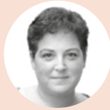
BEIA SALABERRI IRAKASLEA

D uela bi aste, Frantziako irratien finantziamentua zalantzan zen, Frantziako Kultur Ministerioak %35 apaldu nahi baitzituen elkarte irрати lokalei bideratu dirulaguntzak. Orduan, 200 bat elkarte ziren lanje-rean eta horien artean Iparraldeko Euskal Irratiak.