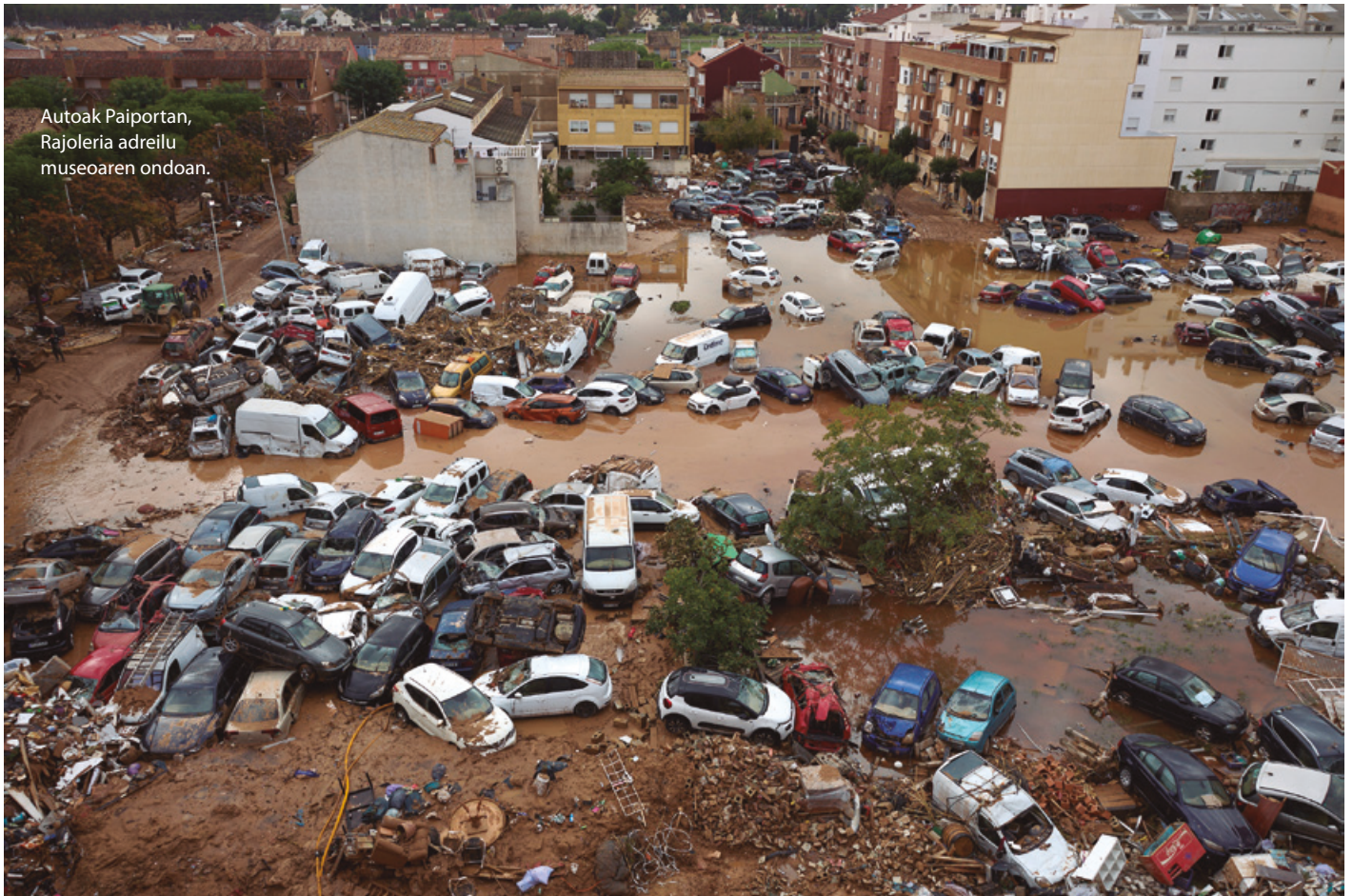
Autoak Paiportan, Rajoleria adreilu musearen ondoan.

ri den bezala: kaleak tobogan hilgarri bihurtuta, urak autoak eta etxeak aurretik eramaten.