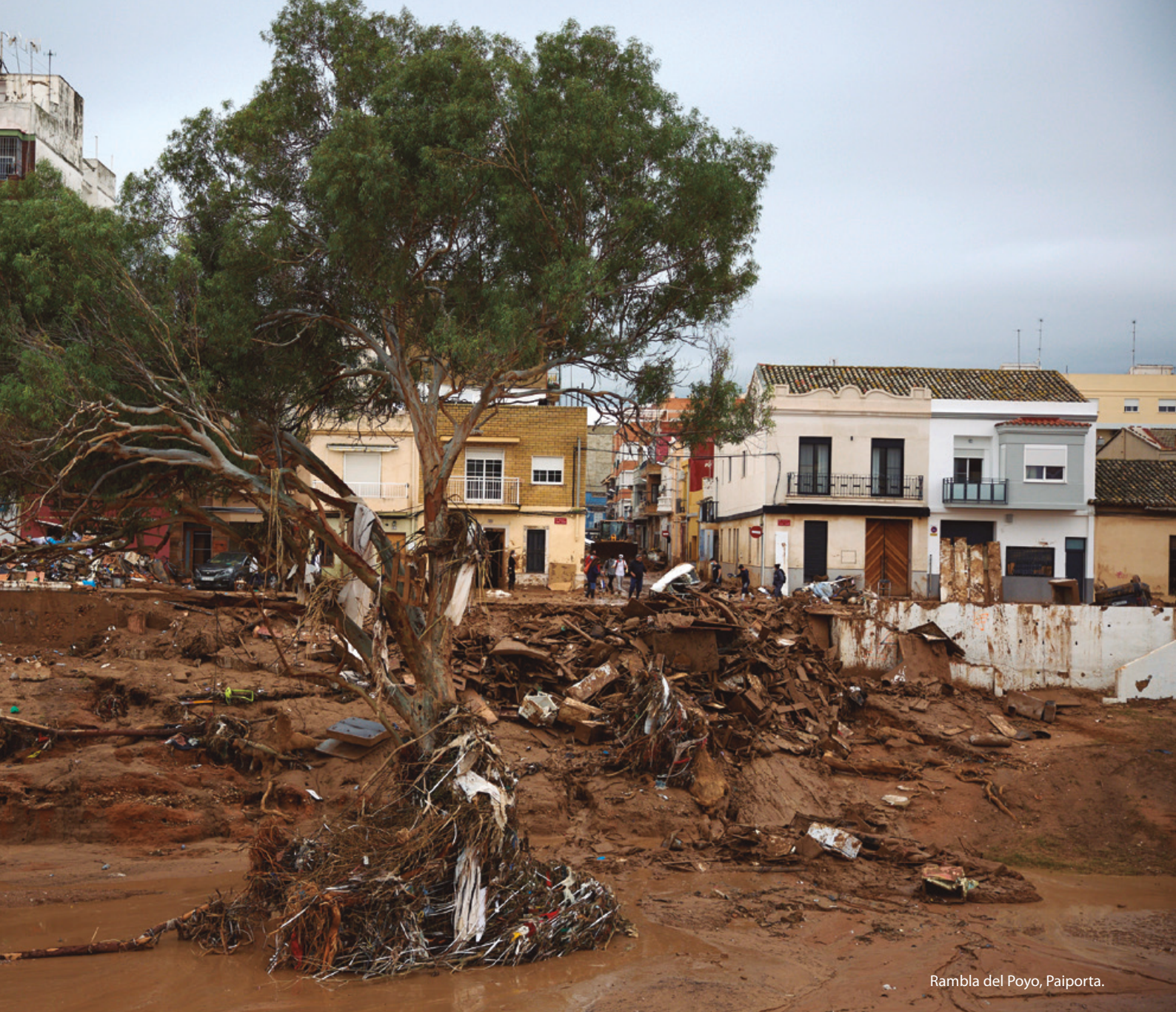
Rambla del Poyo, Paiporta.

tenean. Fenomeno horren adibide dramatikoa litzateke Valentziako l'Horta de Sud deituriko hegoaldeko lur emankorrean gertaturikoa.