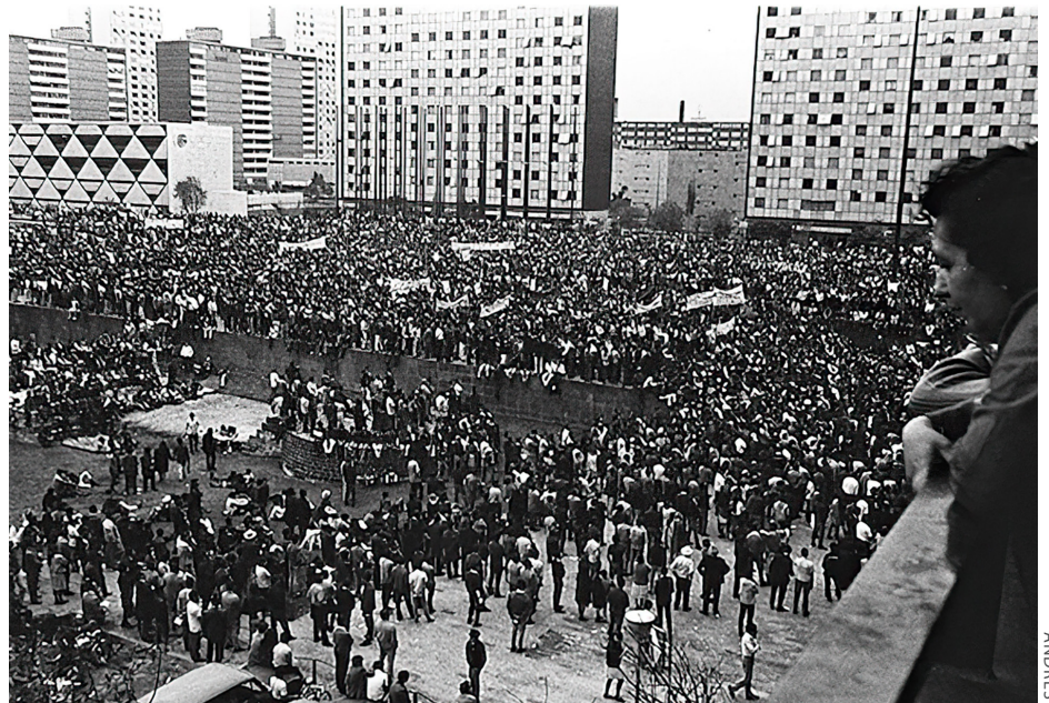
Ikasleak Mexikoko Hiru Kulturen Plazan bilduta, 1968ko urriaren 2an.

Duela bizpahiru aste, Tlatelolcoko sarraskiaren 56. urteurrenean, Claudia Sheinbaum presidente berriak, dekretua sinatu zuen Estatuaren izenean biktimei barkamena eskatzeko. Sheinbaumek inbestiduraren ondoren hartutako lehen erabakia izan da, eta lehen aldia da, gainera, Mexikoko Gobernuak sarraskiari buruzko