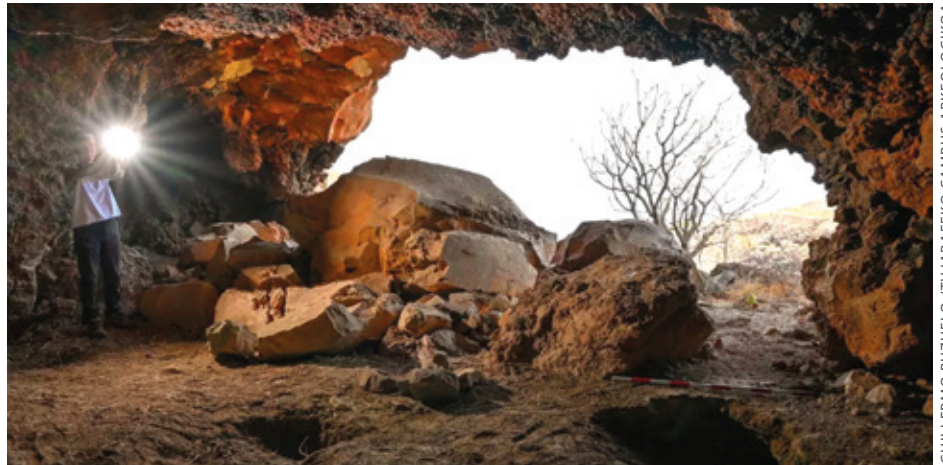
Tijarafeko campus arkeologikoan uda honetan ikertutako kobazuloetako bat.

Baina gaztelarrak iritsi zirenean, sinbolikoki nahiz ekonomikoki jabetu ziren inguru haietaz. Monje katolikoaren ondoren, XV. mendean, konkista militarra iritsi zen, eta horrekin batera ebanjelizazio behartua. “Indigenen praktikak debekatu zituzten, uharteetako kosmogonia baztertu zuten eta ezagutza modu pro-