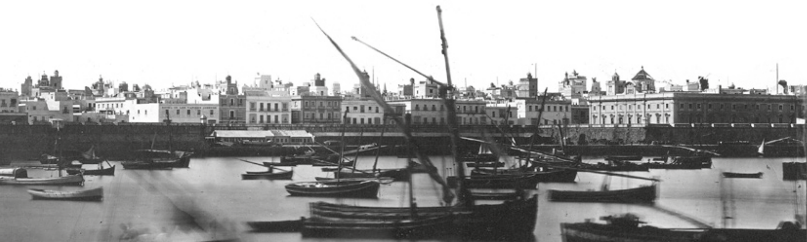
Cadizko moila 1867an, esklabo trafikoaren garaian.

Portugaldar eta ingelesei kopiatuta, esklabotza negozio handi bat bilakatu nahi izan zuen espainiar koroak XVIII. mendearen erdialdean. Bere kolonietan loratzen ari ziren azukre sailentzako erregaia, eskulana, giza haragia behar zuen, eta zuzenean edo " en derechura ", Afrikako kostaldera joateko baimenak ematen hasi zen. Hor ere euskaldunak izan ziren aktore printzipalak.