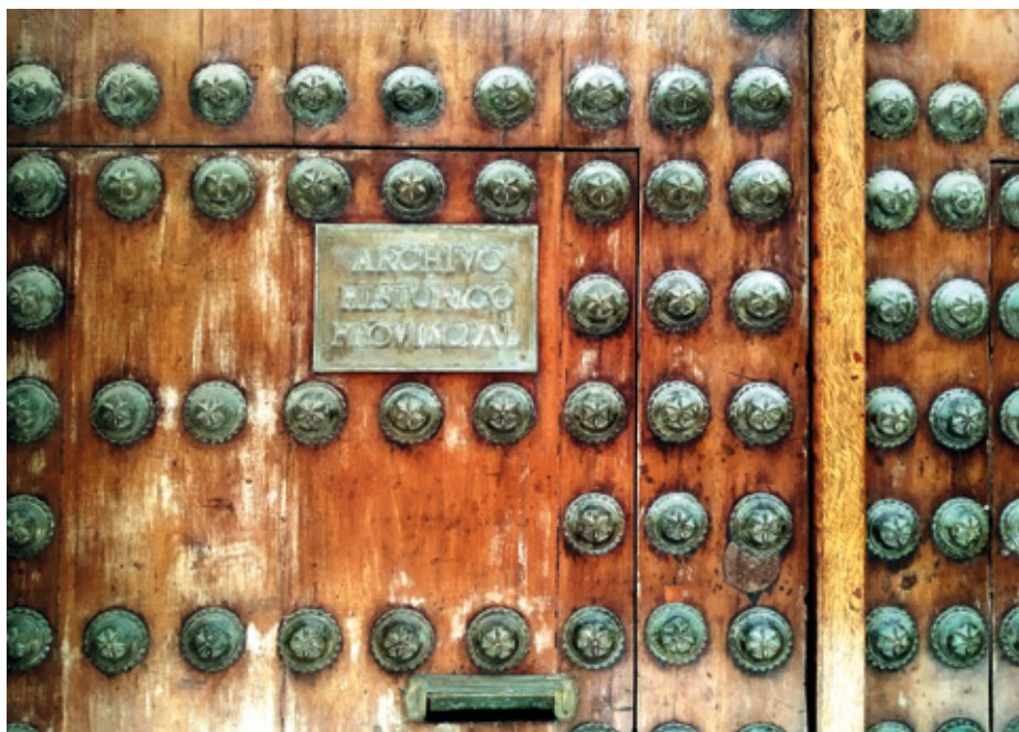
Cádizko Probintzia Artxibo Historikoko atea, Cristobal Colón kalean.

Oso berandu arte iraun zuen esklabotzak Cádizen, hainbeste, ezen Europako azkenetako portua izan zen garraio genozida hori praktikatzan, 1866. urtera arte.