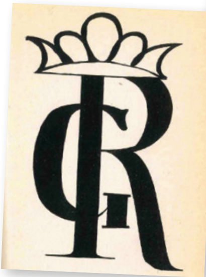
CADIZKO PROBINTZIA ARTXIBO HISTORIKOA