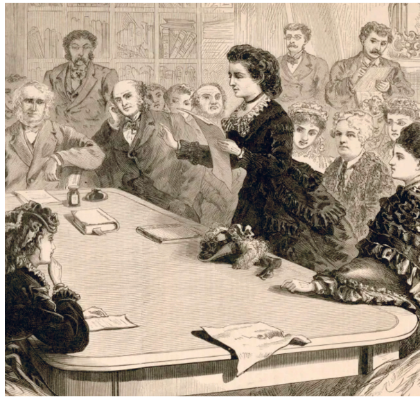
Victoria Woodhull AEBetako kongresuan emakumeen sufragioaren alde hitz egiten, 1871n

Eskubide horren alde, AEBetako kongresuko batzorde batean hitz egin zuen lehen emakumea ere izan zen. 1871ko urtarrilaren 11n izan zen hori. Woodhullek esan zuen emakumeek boto eskubidea lor zezaten ez zela beharrezko konstituzioa aldatzea edo zuzenketarik sartzea, jatorrizko testuak berak jasota zeukala, ondo interpretatuz gero. Kongresukideak ez zituen konbentzitu, baina mugimendu sufragistaren hainbat buruzagi bai. Gainera, sufragisten mugimenduan profil berezia zen Woodhullena; sufragista gehienak goi burgesiakoak ziren eta Victoria, aldiz, pobreziatik zetorren.