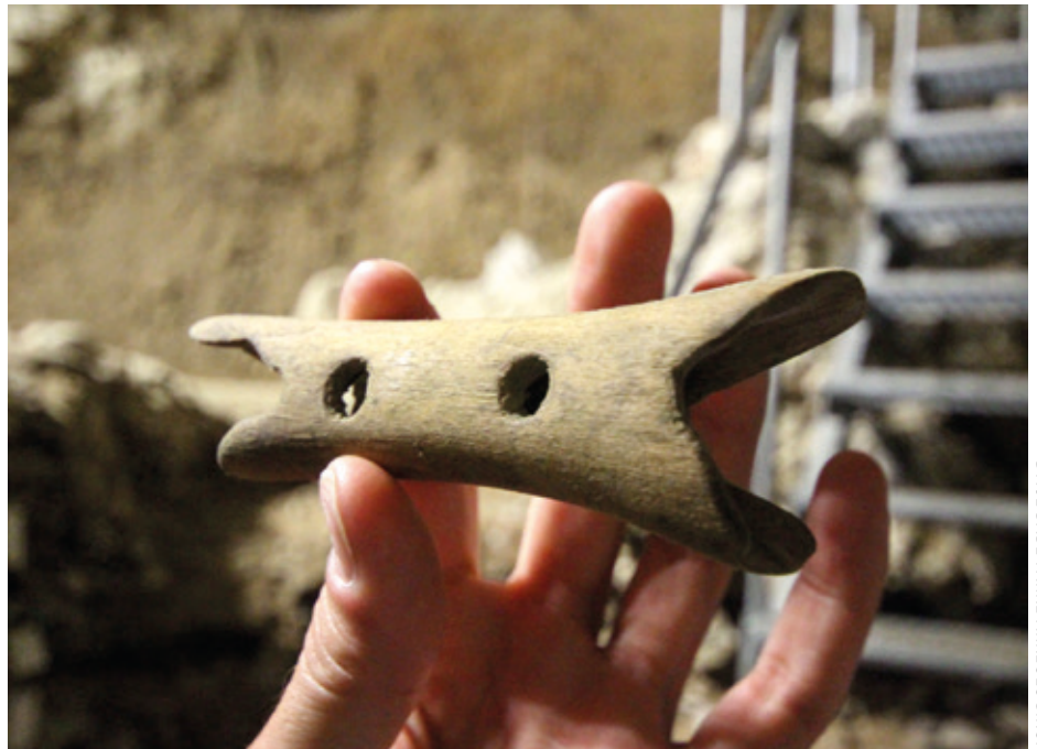
DIVJE BABE PARKE ARKEOLOGIKOA