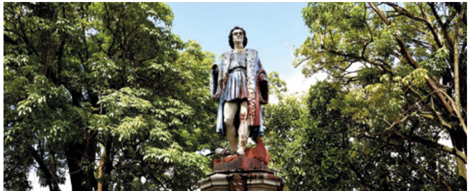
Colón plazan dagoen Colónen omenezko estatua, plakan ondokoa dioena: "Irlaren aurkitzailea".

Hiriburuko auditorio batean Cristóbal Colón eta garai kolonialeko beste figura batzuk eztabaidagai izan zituzten joan den astean. Parte hartu zuten bi dozenatik gora pertsonak, eta Internet bidez parte hartu zuten beste hainbatek, sinbolo eta izen kolonialak kentzearen alde egin zuten.