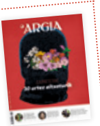
AZALEKO IRUDIA: CGT