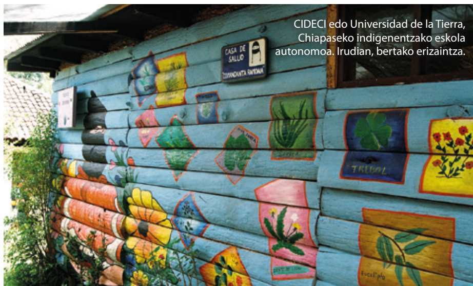
CIDECI edo Universidad de la Tierra, Chiapaseko indigenentzako eskola autonomoa. Irudian, bertako erizaintza.