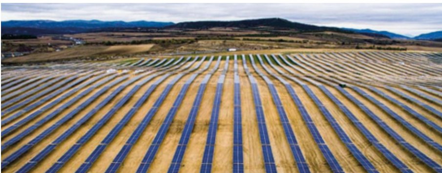
Erriberabeitia 2020tik dagoen eguzki-zentral honek 55 hektarea hartzen ditu eta EAEko handiena da. Ia hiru bider handiagoa izango da Solariak eraiki nahi dituen 25 zentraletako bakoitza.

Bermigrazioa defendatzen dute bai Neue Rechtek eta bai AfD; bereziki Höckek. Hau da, migratzaile ororen deportazioa, herrialde bakoitza "herritar autoktonoena" soilik balitz bezala. Lehenik, "legez kanpoko migratzaileak" kanporatu behar direla diote, premia bizia horretan dagoela argudiatuta; eta bigarrenik, herrialdean asentatuta dagoen etorkin oro, "herrialdearen izatea segurtatzeko". ●