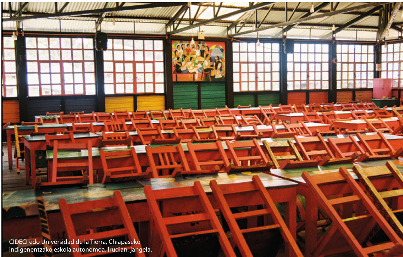
CIDECI edo Universidad de la Tierra, Chiapaseko indigenentzako eskola autonomoa. Irudian, jangela.

Munizipio Autonomoak, Caracolak eta Gobernu Onaren Batzordeak sortu zituzten 2000ko hamarkadaren hasieran, eta, horrela, estatu egiturarik gabeko iraultza eraginkorra garatu zuten zapatistek. Egun, ordea, abiadura bizian ari dira eraldatzen, eta iaiztik hona, egi-