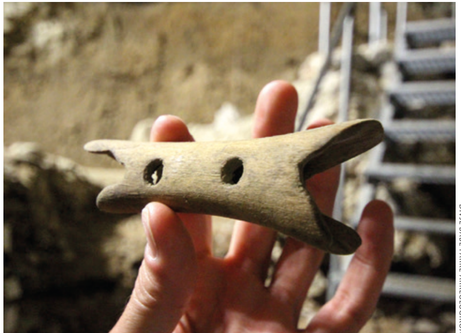
DIVJE BABE PARKE ARKEOLOGIKOA