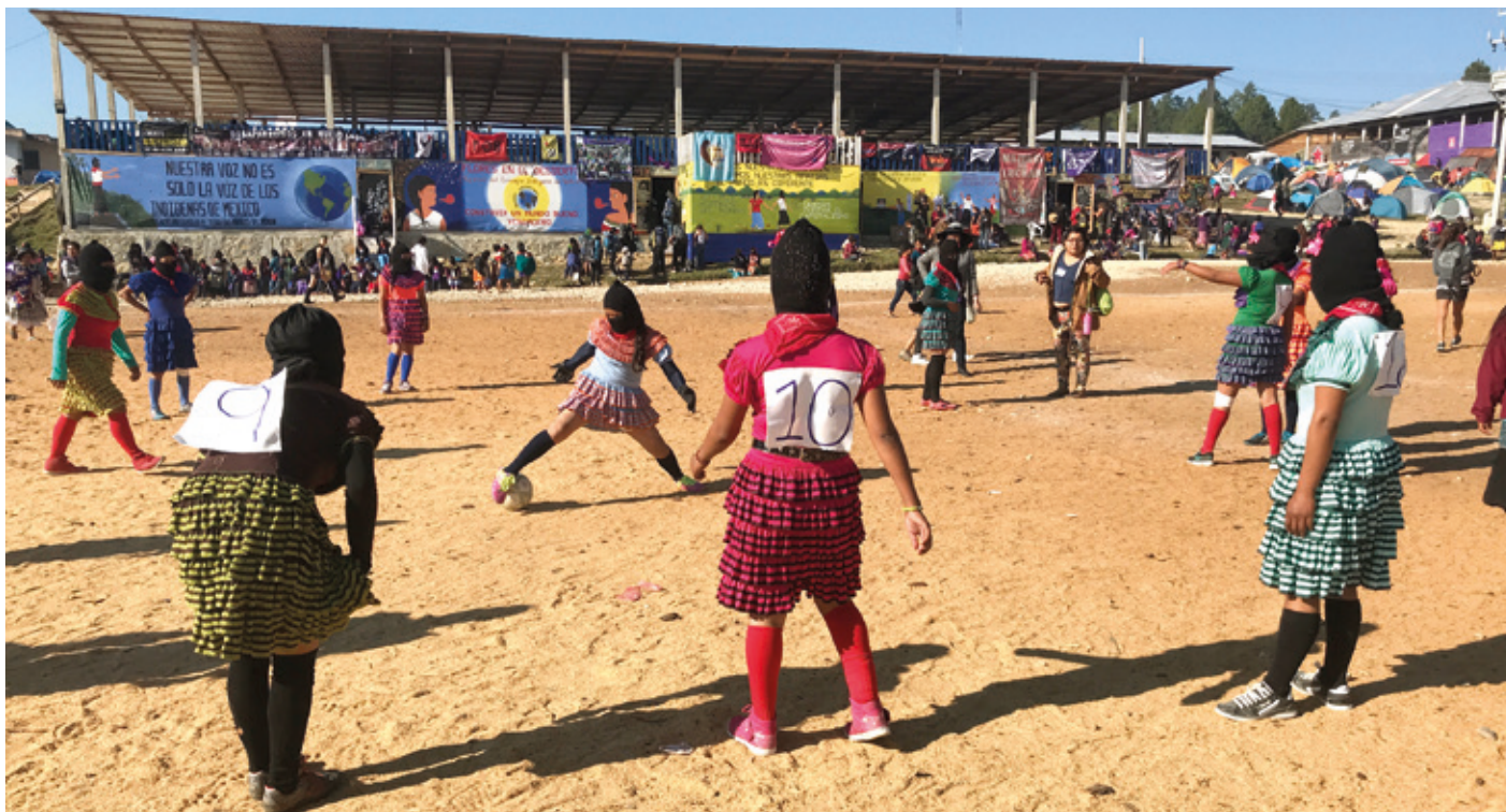
GLOBAL JUSTICE NOW

Hainbat emakume zapatista, emakumeen topaketa batean, futbolera jolasten.