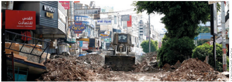
Bulldozer israeldarrek Jeningo kaleak eta dendak suntsitu dituzte.