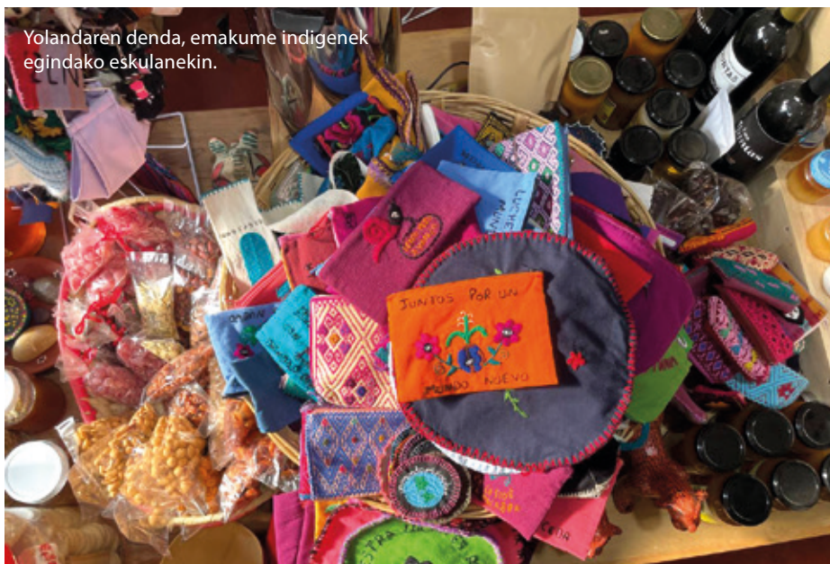
Yolandaren denda, emakume indigenek egindako eskulanekin.

Kokainaz gain, trafikatzailiek beste “merkantzia” bat ere mugitzen dute: pertsonak. Lehen, migratzaileen hamar pasabide zeuden Guatemalatik Chiapasera; egun, 90 baino gehiago dira