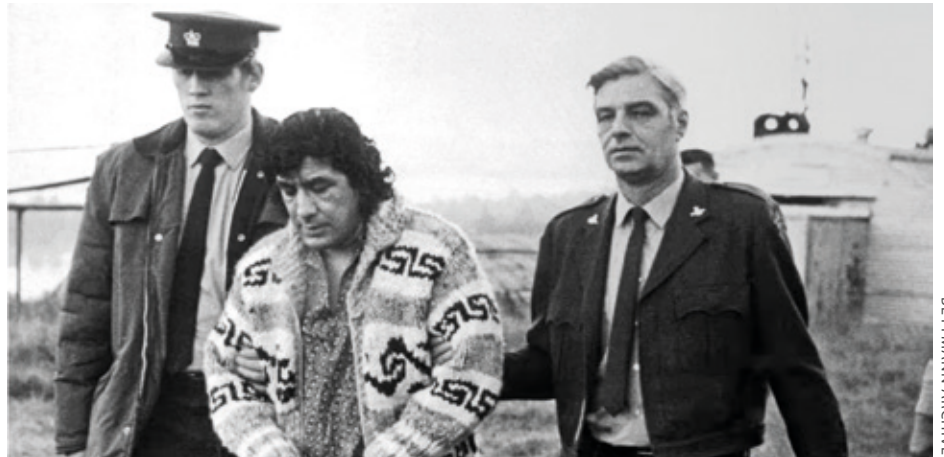
Leonard Peltier 1976ko abenduan, Oakalla espetxean (Kanada), AEBetara eramango zuen helikopteroa hartzeko bidean.

Gerora jakin zen FBIk disidentziaren aurkako Cointelpro kontrainteligentzia programa erabili zuela bere aurka. Cointelpro programa "Estatu Batuetako Alderdi Komunistaren jarduna eteteko" sortu zen berez, baina beste talde batzuk ere