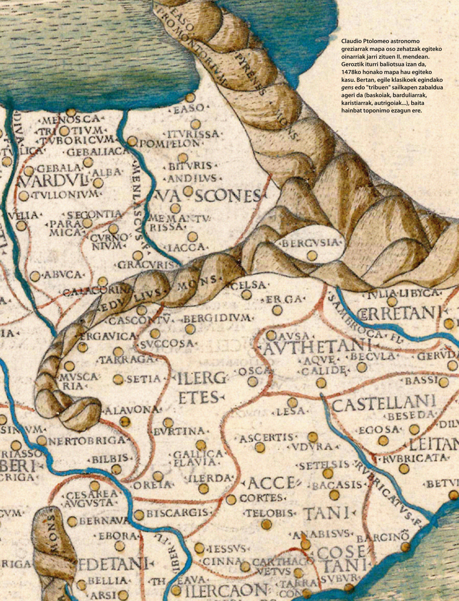
Claudio Ptolomeo astronomo greziarrak mapa oso zehatzak egiteko oinarriak jarri zituen II. mendean. Geroztik iturri baliotsua izan da, 1478ko honako mapa hau egiteko kasu. Bertan, egile klasikoek egindako gens edo "tribuen" sailkapen zabaldua ageri da (baskoiak, barduliarrak, karistiarak, autrigoiak...), baita hainbat toponimo ezagun ere.