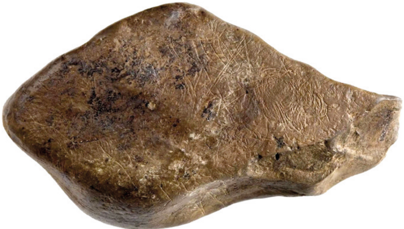
Abauntzeko mapa historiaurreko gizakiak grabatu zuela uste dute adituek eta mendiak eta ibaiak daude irudikatuta, animaliekin batera.

Baina atlasari garrantzia ez dio ematen biltzen duen zorroak, baizik eta bere