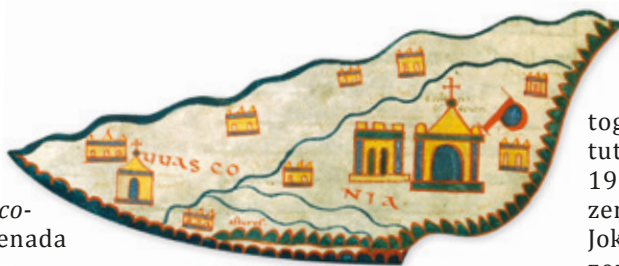
Liédénako Beatoak 1050 urtean egindako mapamundiaren xehetasuna, UUasconia hitza irakur daiteke Pirinioen iparraldean, Saint Serverreko monasterioaren irudi ondoan.

XIX. mendea gatazka ugaritan murgildu zen eta armada handien behar militarrek asetzeko mapa joriagoak ugaritu ziren orduan. Baina korrante liberalek herrien benetako izatea estatu-nazioetara kimatu zuten, eta ondorioz, sarri