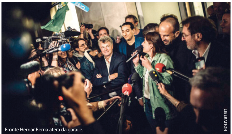
Fronte Herriar Berria atera da garaile.

Ez du, ordea, gehiengo osoa lortu ezkerrek -289 diputatu- eta hori horrela, Legebiltzarrean 2022az geroztik egondako blokeo eta buruhauste sutsuak aurreikusi daitezke legealdi honetan ere (hain zuzen, 2022an galdu zuen gehiengo osoa Macronen alderdiak). Lehen ministro Gabriel Attalek dimitituko duela jakitera eman du emaitzak jakin bezain laster: "Errepublikar tradizioari segi, nire dimisioa aurkeztuko diot Errepublikako presidenteari". Ensemble mac-