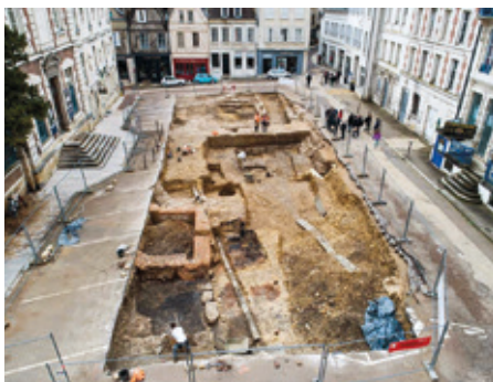
CHRISTOPHE FOUQUIN, INRAP

1986tik Europar Batasunaren ereserkia den lana inoizko piezarik interpretatuena da, eta, bigarren mendeurrenaren aitzakian, lehen postu hori indartu besterik ez da egin aurten. 200 urte horietan 9. Sinfoniaren doinua guztiz barneratu dugu, Schillerren hitzek gordetzen duten mezua, ordea, ez. ●