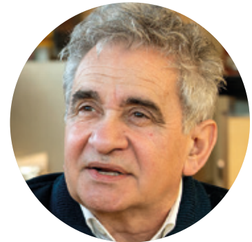
DANI BLANCO / ARGIA