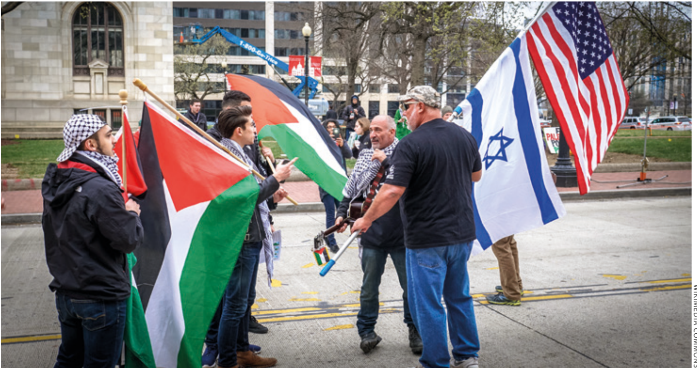
Sionistak palestinarren aldeko ikasleen kontra egiten Washingtonen, AEBetan.