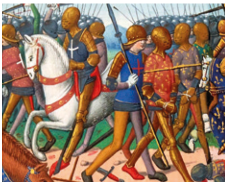
MUSÉE DE L'ARMÉE

Overlord operazioak iraun zuen bitartean hildako milioitik gora soldadu eta zibiletatik soilik 55.000 ziren Normandian lehorreratutakoak. Baina horiek dira balio dutenak. ●