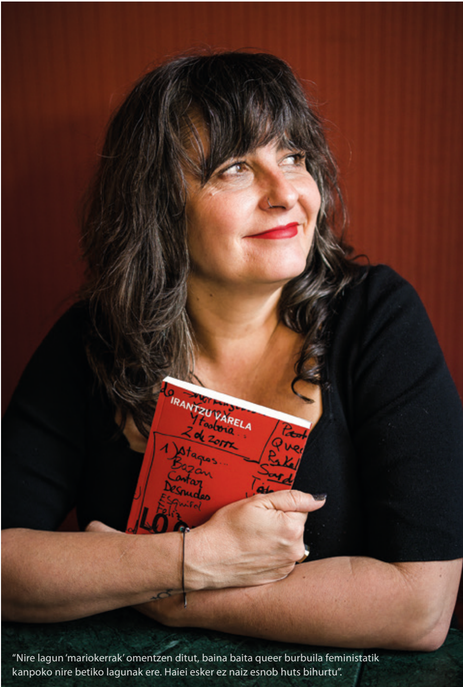
"Nire lagun 'mariokerrak' omentzen ditut, baina baita queer burbuila feministatik kanpoko nire betiko lagunak ere. Haiei esker ez naiz esnob huts bihurtu".

titzeko. Neronek, arestian, horri buruz idazten nuen mozkortuta edo bereziki asaldatuta nengoenean. Lotsa ematen zidan onartzeak helduaroan gertatu zitzaidala, prestakuntza feminista banuen ere. Gaur egun modu gogoetatsuan partekatzen ikasi dut, oka egin beharrean, eta "niri ere gertatu zait" erantzuten didazue askok. Zuri gertatu ez bazaizu, aparteko zortea izan duzu, edo akaso ez duzu zure bizitzaren irakurketa kritikoa egin. Bi psikologok esan zidaten nire dokumentaleko protagonistok torturaren