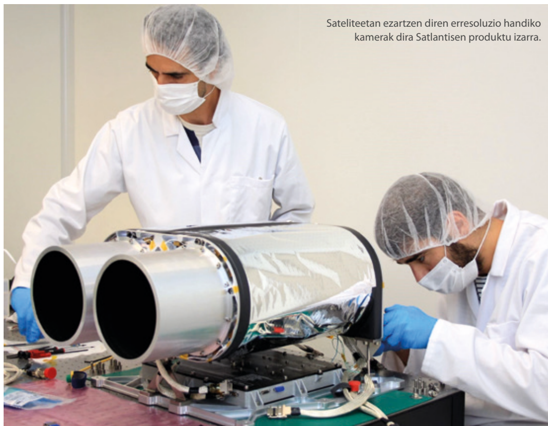
Sateliteetan ezartzen diren erresoluzio handiko kamerak dira Satlantisen produktu izarra.