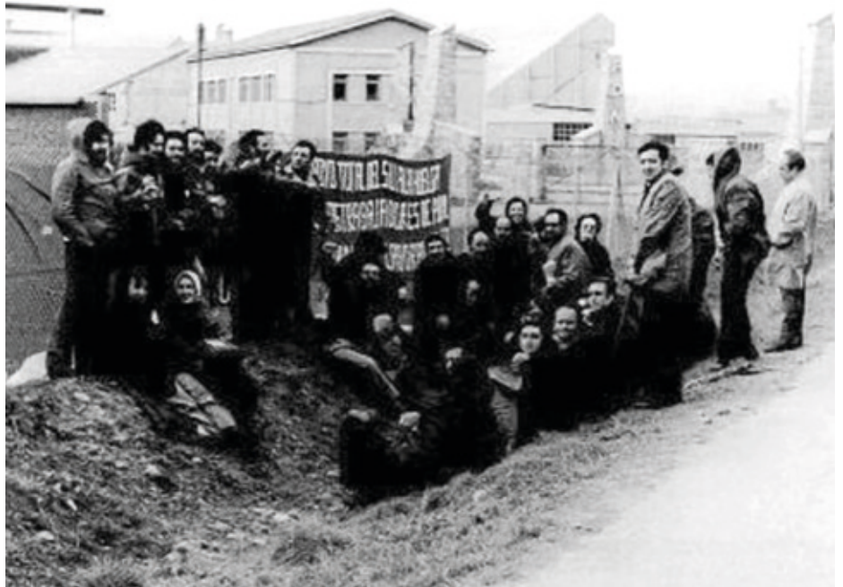
1975eko urtarrilean Potasas de Navarrako 47 langilek meategian 15 eguneko itxialdia egin zuten. Nafarroako enpresarik handienean egindako mobilizazioak oihartzun handia izan zuen.

Geronimo de Uztariz Nafarroako historialarien elkarteak argitaratzen duen