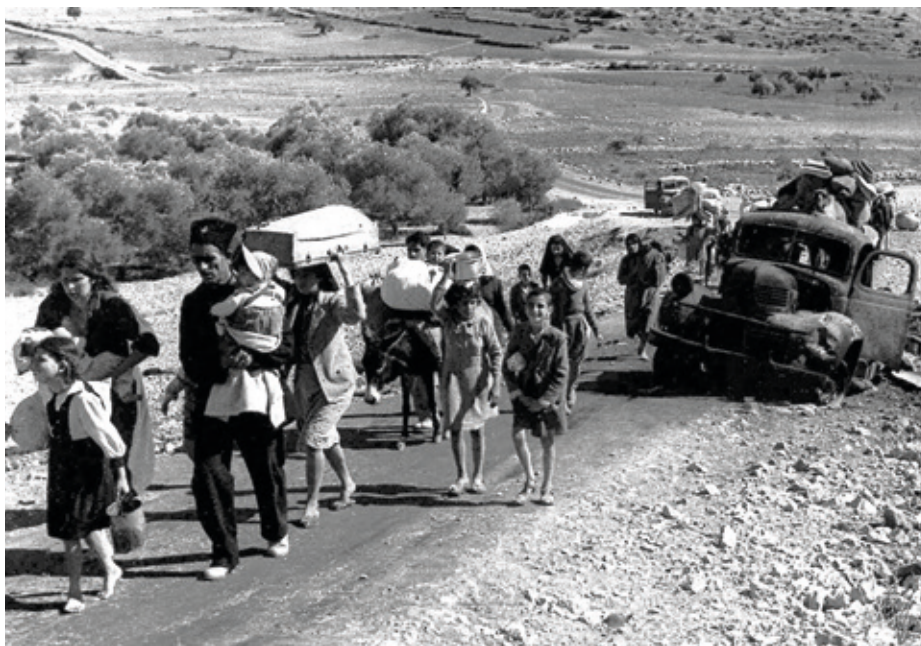
Duela 75 urte 750.000 palestinar beren etxeetatik egotzi edo ihes egitera behartu zituzten. Nakba esaten diote horri eta nazioarteko komunitateak gertatutakoa ukatzen jarraitzen du.

Mendebaldeak 75 urte hauetan palestinar borroka despolitizatu du eta laguntza politiketan garbi islatu da hori. Arafehrek dioenez, "arazoaren sintomei begiratu diete, oinarritzko kausa, hau da,