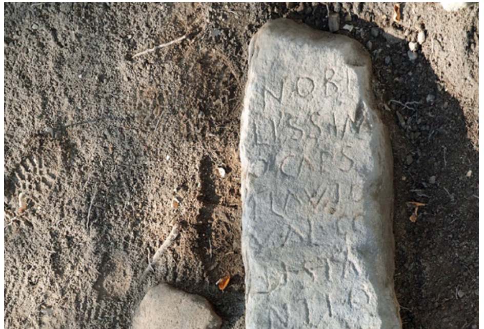
Aranzadi Zientzia elkarteko kideek Ibañeta inguruetan aurkitutako erromatar miliarioa.

Ibilbide hori egiten duenak ez du harlauzaz egindako biderik topatuko. Hori