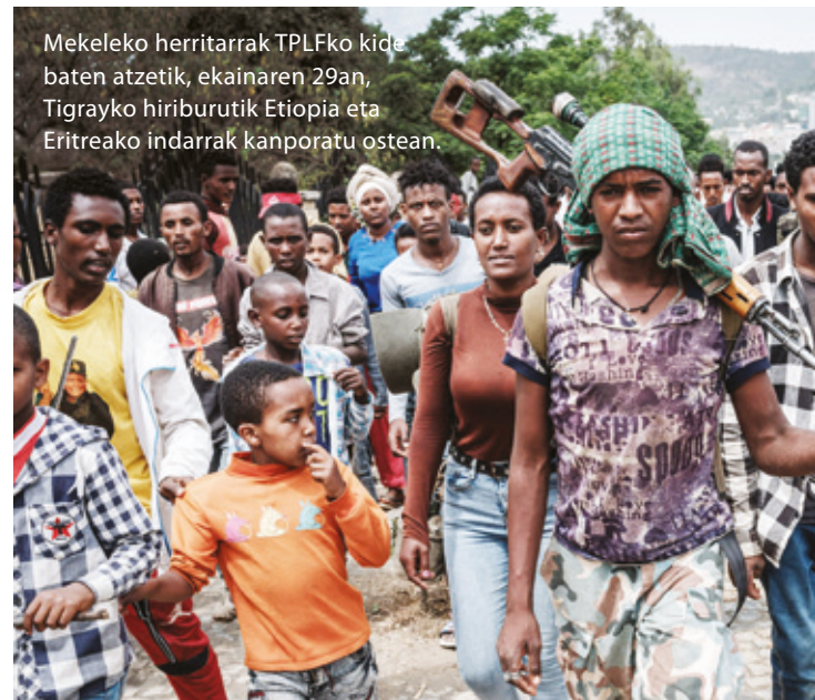
Mekeleko herritarrak TPLFko kide baten atzetik, ekainaren 29an, Tigrayko hiriburutik Etiopia eta Eritreako indarrak kanporatu ostean.