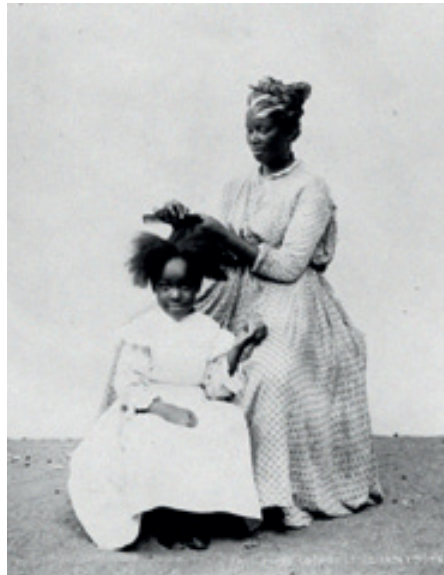
Karibe aldeko esklabu afrikarrek ilean txirikordak egiteko ohiturari eutsi zioten eta txirikorda haiek askatasuna lortzeko bidea eman zieten askori.

Granada Berriko esklaboak ez ziren bakarrak izan Afrikan, aske zirenean, zituzten ohiturei ahal zen neurrian eusten. Beste leku batzuetan ere ilea txirikorda bihurrietan biltzen jarraitu zuten, nola edo hala identitateari eutsi nahian. Bai-