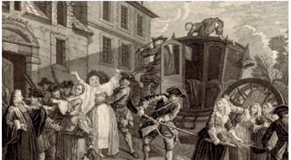
‘POLIZIAREN ATXILOKETA’ (1757), JEANRAT-EK EGINA ETA J.C. DUFLOS-EK GRABATUA.

XVIII. mendean polizia profesionalizatu eta espezializatu egin zen; orduan sortu ziren lehen detektibeak. “Ordinari eusteko” aterki zabal eta lausoaren azpian, lan eremu asko egokitu zitzaizkion polizia berriari: lan arauak kontrolatzea, osasun publikoa zaintzea, delituak saihestea, pertsonen eta gaien zirkulazioa hobetzea... Ideia ilustratuen optimismoarekin bat eginez, polizia hobekuntzarako instituziotzat jotzen zuten, gizakien zorientasuna bermatzeko tresna ia zientifikotzat, aurrerapenerako bitartekotzat. Gainera, beste eremu batzuetan egin ziren aldaketak lagun izan zituen poliziak: kale-argiteria hobetzeak eragina izan zuen segurtasun publikoa zaintzeko, adibidez, eta dokumentuen