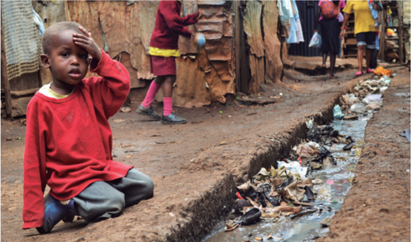
HAURRAK NAIROBIKO KIBERA TXABOLATEGIAN 'ESTOLDA' ONDOAN. "Jakina denez, munduan osasun publiko mailako arazoetan larriena da ur garbi eta komun falta, hilkortasunik handiena eragiten duena, bereziki haurren artean".

saiatu ziren kontzesio horiek desegin eta gerra industriak berriz pribatizatzen; sindikatuek eta ezkerak, berriz, borroka egin zuten eusteko aldi baterako irabazitakoari. Horregatik izan zen 1919.a historiako greba olderik handieneko urtea.