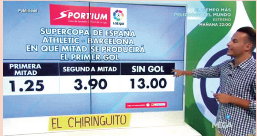
Mega telebista kateko El Chiringuito saioko aurkezlea, futbol partida baten inguruko apustuez hizketan.

Bai, iragarkiak kendu zituen, baina, esaterako, Arguiñanorekin kontratua sinatu zuen, pilota emanaldien eskubideetarako. Bainer, Asegarcé... Codere da pilotaren babesle nagusia, eta zuzenekoetan haren logoa telebista pantailan ikus dezakegu tartean behin. Pilotarien sailkapen-