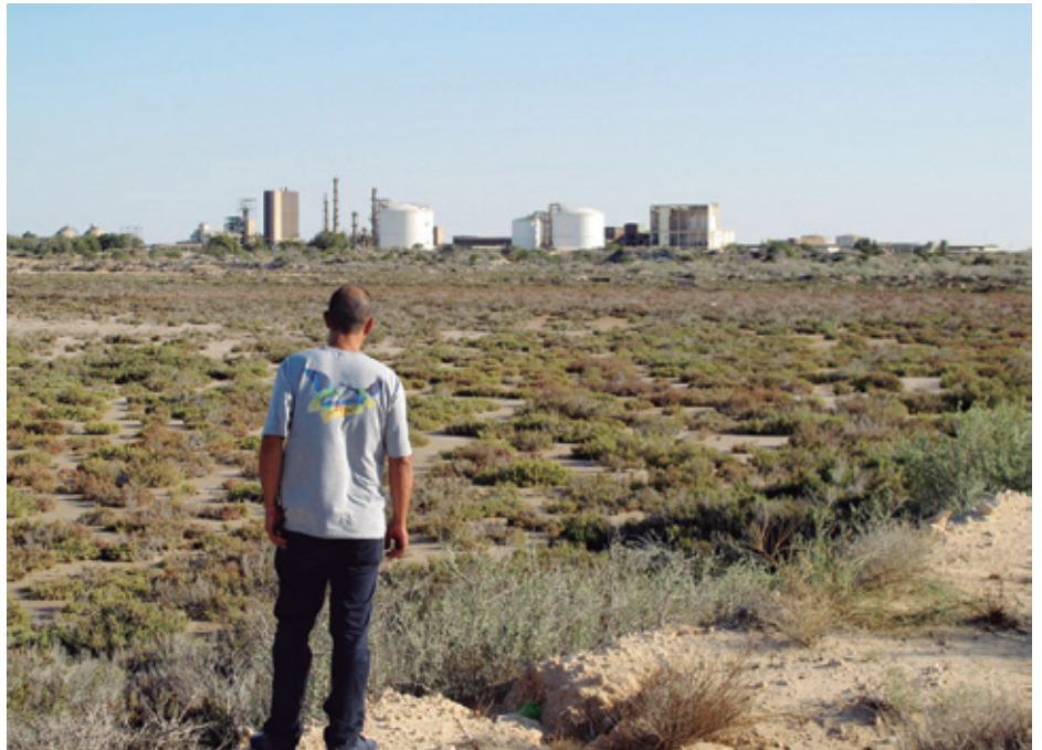
Bukamasheko planta kimikoak lurra eta itsasoa kutsatzen jarraitzen du.

"5.000 migrante iritsi zitzaizkigun handik, oinez. Gizatasunagatik arropa, jatekoa eta oinarrizko batzuk eman behar genizkien, baina nekez iristen da guretzako", zioen alkateak. Udalaren aurrekontuaren erdia "segurtasunerako" bideratzen dutela azpimarratu zuen jarraian. Kazetari honek elkarriketatutako migratzaile gehienak bat zetozen: Zuara eta Misrata ziren eurentzako hiri seguruenak, eta Tripoli arriskutsuene-