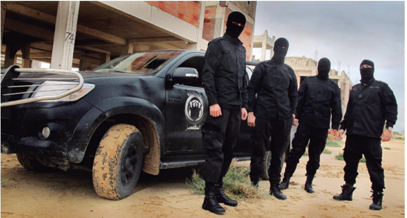
Zuarako Imsuten brigadak giza-trafikoarekin bukatu zuten, baina baliabide ezak unitatea desaktibatu zuten.

ko asmoz. 35 kide zituen: sendagileak, suhiltzaileak, poliziak... Denen artean, Imsuten –"maskaradunak" amazigen hizkuntzan– izeneko brigada antolatu zuten. Giza-trafikorarekin bukatzea zuten helburu, eta halaxe egin zuten.