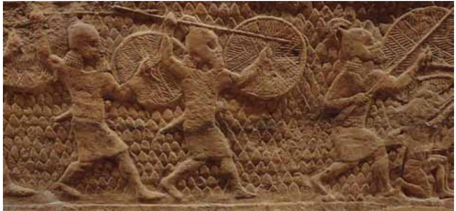
Duela hiru urteko ikerlan baten arabera, duela 3.000 urte baino gehiago soldadu asiriarrak trauma osteko estresa izan ohi zuten.

Azalpen nabarmen eta egiaztagarrikerik gabe, arduradun militar askorentzat koldarkeria zen; hala, dozenaka soldadu heriotzara kondenatu zituzten. Ahalegin batzuk ere egin ziren sintoma horiekin modu eraginkorragoan arintzeko –eta fronteetan soldadu kopuruari eusteko–, gaixoei egun batzuetako atsedena emanaz, baina 1917an Armada Britainiarrek guztiz debekatu zuen diagnosia, eta armadaz kanpoko medikuntza dokumentuetan ere zentsuratu egin zuten. Arerioentzat ere tabua zen gaitz hura. Zurrumurruak dio Adolf Hitler bera,