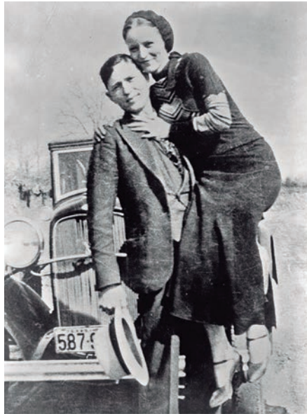
Ezkerrean, Bonnie (1910-1934) eta Clyde (1909-1934), Ford V8 autoa atzean dutela. Eskuinean, Henry Fordi Clyde Barrowek (ustez) bidalitako gutuna, autoaren bertuteak goraiapatuz.

Bonnie eta Clyde hil baino hilabete lehenago, Clyde Barrowek Henry Fordi (1863-1947) idatzi zion, bere produktuarengatik zorionduz. "Biriketan airea geratzen zaidan bitartean, auto bikaina egin duzula esango dizut", hasten zen eskutitza. Gaizkileak zioen beti Ford V-a lapurtzen ahalegintzen zela, ihes egiteko parekorik ez omen zuelako. Fordek, eskutitza bere museoan jarri zuen ikusgai, ezusteko kanpaina are gehiago bulztatuz.