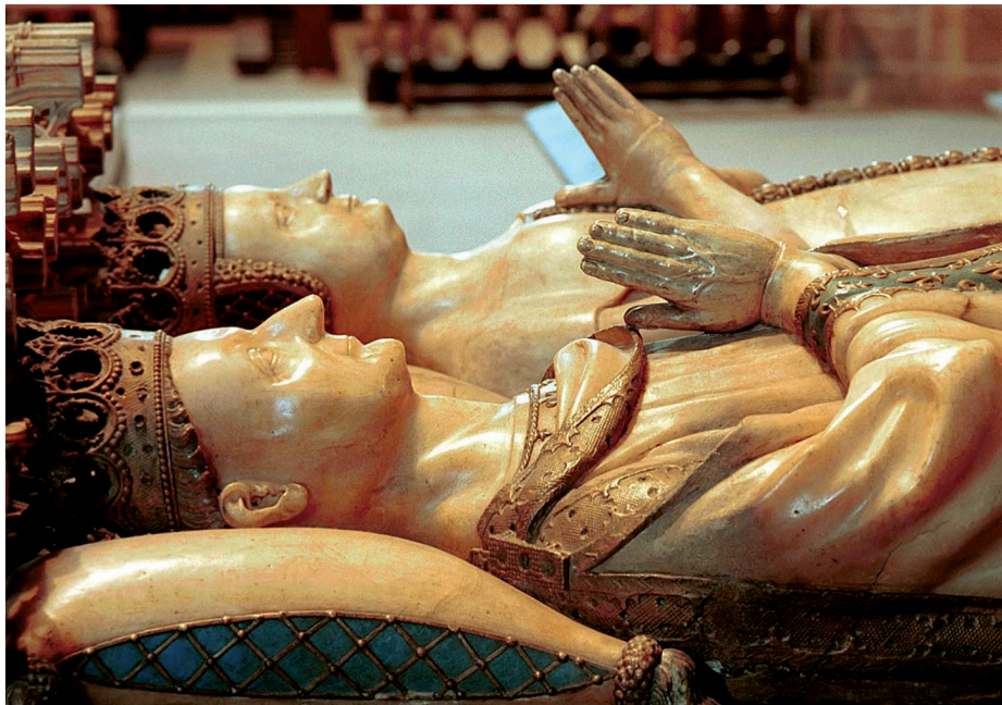
Karlos III.a Noblea eta Leonor Trastamarakoa Nafarroako errege-erreginen mausoleoa, Iruñeko katedralean. Karlos III.ak 1393an berreskuratu zuen Cherbourg Nafarroarentzat, eta hamaika urte geroago 200.000 libarren truke saldu.

1353an eskuratu zuen Nafarroako Erresumak Cherbourg lehenengoz. Frantziako errege Joan II.a Zintzoak "Cherbourgeko jaurerri eta hiribildua" Joana Valoiskoa alabari eman zion ezkonsari, Nafarroako errege Karlos II.a Evreuxkoarekin (1332-1387) ezkondu zenean. Frantziarren oparia ingelesen zerbitzura jartzea erabaki zuen handik hiru urtera Filipe Evreuxkoa infanteak,