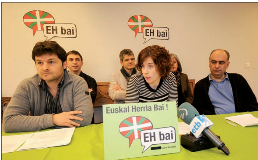
EH Bai-ko kideek orain arteko koalizioa ezkerreko mugimendu bateratua bilatzeko emandako urratsak azaldu dituzte hil honetan, Baionan.