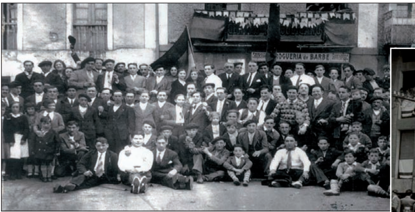
Bi irudi eta gerra bat erdian. Goian, 1934an ospakizun ezkertiarra Villabonako plazan; bandera errepublikarra ageri da atzean dagoen Zentro Errepublikanoan. Eskuinean, toki bera urte batzuk geroago; bandera espainola jarri dute aurrekoaren tokian eta desfile katolikoa ari dira egiten.