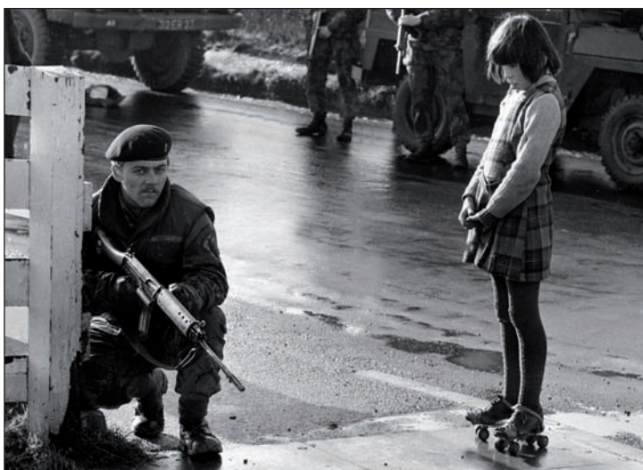
Teorian katoliko eta protestanteen arteko indar gisa heldu zen armada britainiarra Ipar Irlandara 1969an.

Aliatu bilgarriak 2013ko urria amaieran kaleratu zen eta, gezurra badirudi ere, ikerketa liburu hau izan da azaroa eta abenduan Ipar Irlandako liburu salduenetakoa: 12.000 ale. 1972tik 1978ra Armagh eta Tyroneko konterrietan talde paramilitar loialistek auzaz hildako 120 katolikoren ikerketa zehatza egiten du. Ezaguna zen katolikoek hilketetan talde loialista eta armada eta segurtasun indar britainiarren artean egondako konplizitatea, baina liburu honek frogatzen ditu tinkoak ematen ditu. Pat Finucane Centerrek bultzatutako lana da.