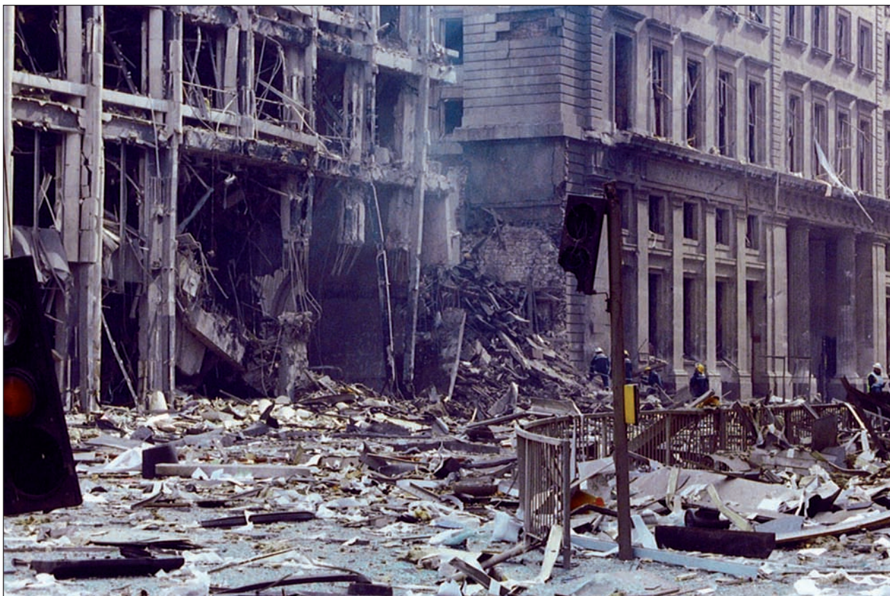
NATIONAL ARMY MUSEUM (UK)

Bake prozesuak 1998an ekarri zuen Ostiral Santuko Akordioa. Bakea. Errepublikar eta loialisten artean oraindik ere badira harekin ados ez dauden talde armatu txiki batzuk, baina oro har, bakea eta elkarbizitza eraikitzen jarraitzen dutela azpimarra liteke. Eta, ispilu latzaz gain, iragana zama ere bada eraikuntza horretan. Bake akordioetan argi azpimarratu zen giza eskubideak eta biktimak prozesuaren oinarrietakoa izan behar zutela, eta ezin esan ez dela indarrak jarri horretan. Aurrerapen asko izan dira, baina oraindik bake prozesuan jarritako helburuak bete gabe daude eta esparru