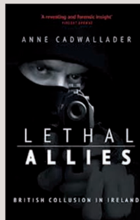
Lethal Allies (Anne Cadwallader).

Ipar Irlanda: iragana kudeatzeko ordua . Amnesty Internationalek argitaratu zuen 2013ko irailean eta biktima eta giza eskubideetan oinarrituta, 1998tik gaurdainoko lanaren oso balorazio kritikoa plazaratzen du. Ipar Irlandako erakunde eta alderdi politikoei kritika zorrotza da, baina batez ere gobernu britainiarrrak bere konpromisoak ez dituela bete azpimarratzen du. Egindako ikerketa lanaren hutsuneak eta ahuldadeak azaleratzen ditu txostenak, eta aurrera begira biktimak arazoaren erdigunean jartzeko egin beharreko aholkuen zerrenda egiten du.