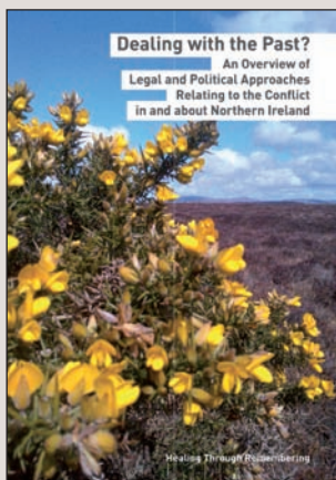
Dealing with the Past? (Healing Through Remembering).