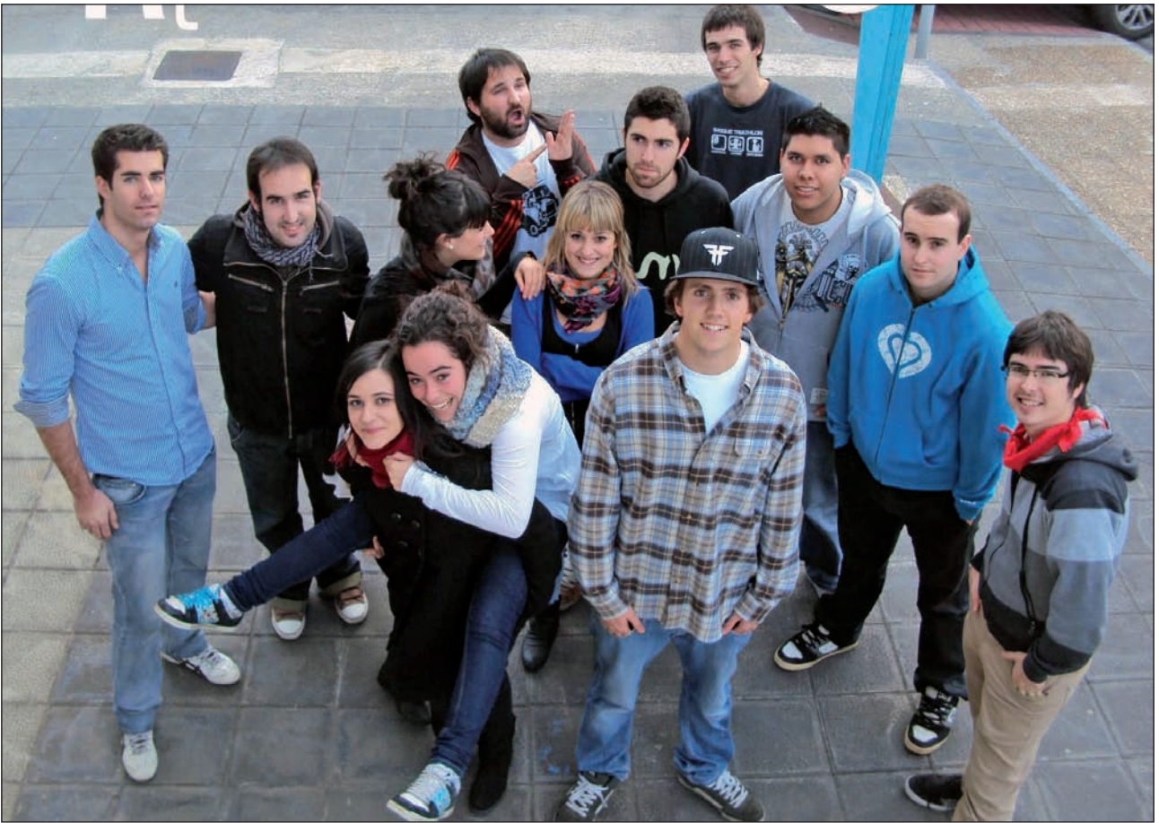
Mondragon Unibertsitateko ikasketen baitan Ta zeba ez? enpresa sortu zuten bederatzik ikasleek, elkarlanean. Kooperatibak izaera ofiziala lortu berri du, lau urteko lanaren ostean.