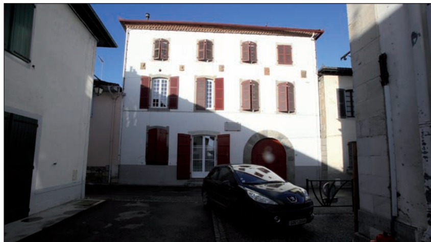
Ezkerrean, Amikuzeko Herri Elkargoaren egoitza, aurretik eliza eta ondoren justizia jauregia izandakoa. Haren parean da Arnaud Oihenart idazle mauletarra bizi izan zen etxea (eskuineko argazkian).

gu: Aiziritze, Domintxine, Maule, Salbatera, Saliese, Pau. Ur gaziaren herria den Saliesen errefuxiatu zen Joana Labritekoa, erlijio gerla denboran. Biarnoko auzo herri horietan oraindik daude protestanteen tenpluak. Mendebaldera, Lapurdi dugu. Ipar-ekialdera aldiz, Peirahorada eta Landak. Bide erdian, mugaldean, xarnegu herria, ahanzturatik hurrantzen. Izan ere, aitzina hiru eledun zen herrialdea lainoak itzaltzen ikusi baitzuen. Oroimena bizirik atxiki nahiz, gaur, Xarnegu musika festibala egiten da urtean behin, Bardozen. Eta Xarnege taldeak jakin izan du Euskal Herriko eta Gaskoiniako doinuak nahiz musikariak biltzen.