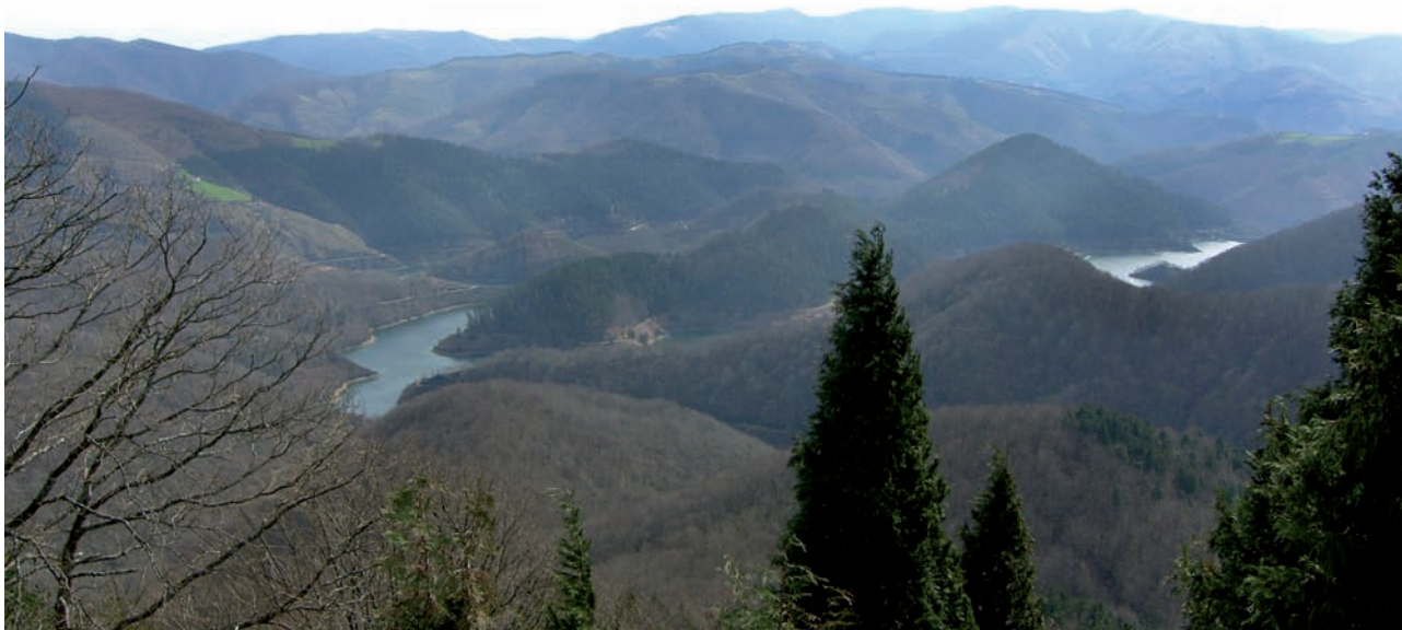
Añarbeko urtegia eta basoak Urdaburuko (598 m.) gailurretik; 900 hektarea baso babestea dute helburu ekologistek.