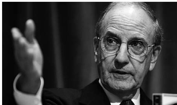
George Mitchell senataria izan zen Ipar Irlandako bitartekarien buru eta ondoren, bere izenarekin ezagun egin diren printzipioak onar zituzaten eskatu zien gatazkako alde guztiei.

Itzul gaitzen Hegoafrikara: Negoziazio prozesu konstituzionalaren lehen bilera formalak World Trade Centre eraikinean egin zen, Johannesburgetik gertu, 1991ko azaroan. Bileraren helburu nagusia negoziazio egituraren lehen osoko bilkura prestatzea izan zen. Lehen osoko bilkura horri Codesa esaten zaio ( Convention for a Democratic South Africa edo Hegoafrika Demokratikorako Biltzarra). Afera nagusia erabakiak hartzeko Codesa zertan oinarrituko zen erabakitzea zen. Gomendioa “nahikoa adostasun” egon beharko lukeela izan zen. Ekitaldi publiko horren zeregina pro-