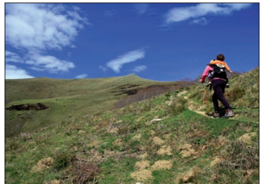
Goiko argazkian, Borda urtegirako igoera. Azpian, Bustizko leporea bidean.

MENDAURRERA IGOTZEKO abiapunturik ohikoena Aurtitz auzoa izan arren, Ituren eta auzo horren erdibidean dagoen San Martin eliza hautatu dugu ibilbidearen abiatutzat. Hala, pinturaz markaturiko ibilbidea jarraitu beharrean, harripilak izango dituzue bidelagun, bordaz borda, Mendaurreko magalak babesten duen urtegiraino igotzerako orduan.