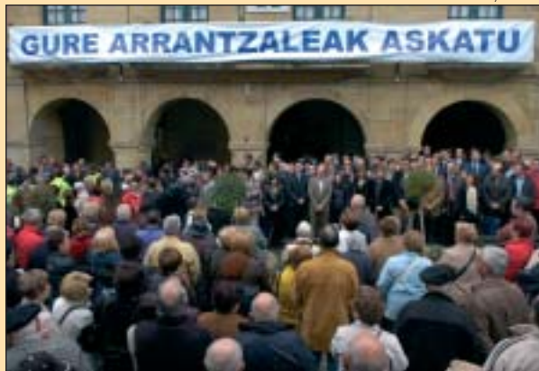
Alakranako arrantzaleen aldeko bilkura Bermeon.

Askok ez daki zer den arrantzaleen bizmodua. Ikusten dituzte etxetik urrun, itsasoan, eguraldi txarrarekin... sentzibilitatea badago. Baina zergatik Indikora? Arraina han dagoelako. Naziorteko urak dira, 200 miliatara, eta japonesak, frantsesak eta errusiarrak ere aritzen dira han. Orain, itsasoan armak hartzea ez da biharko solu-