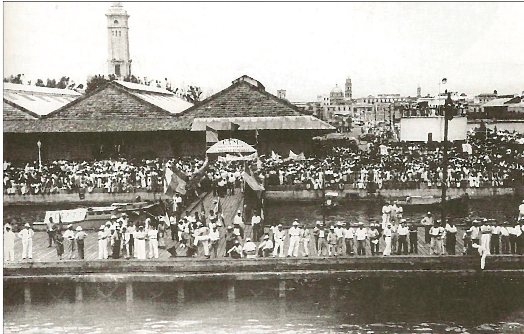
Goiko irudian: Veracruzeko portuan (Mexiko), Sinaia itsasontziari egindako harrera populutsua, 1939ko ekainaren 14an. Espedizio hori izan zen erbesteratuak Mexikora eramateko antolatutako en artean lehenena. Beheko irudian: Sinaia baporea.