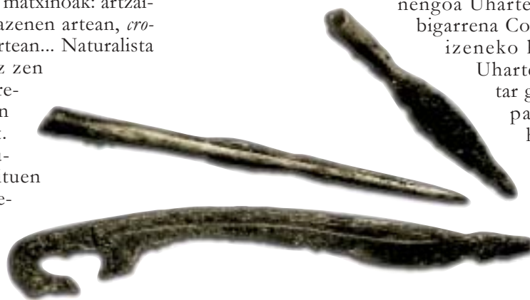
Antzinaroko lantzak. Erromatarrek indarra erabili zuten bagauden matxinadak zapaltzeko.

Zerk bultzatu zituen bagaudak Erromatar agintea biolentzia horrekin erasotzera? Testuingurua garrantzitsua da. Herri "barbaroen" etorrerak ezustean harrapatu