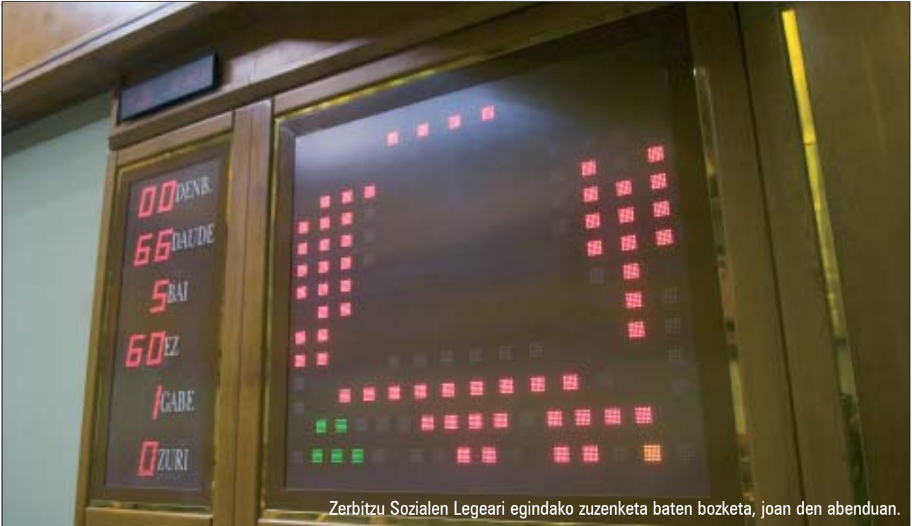
Zerbitzu Sozialen Legeari egindako zuzenketa baten bozketa, joan den abenduan.