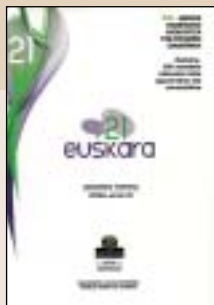
XXI. mende hasierako hizkuntza politikaren oinarriak Batzuen artean EUSKARAREN AHOLKU BATZORDEA 136 orrialde