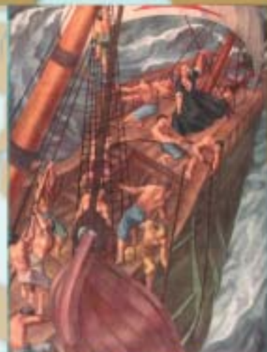
Sarriegiren margoa itzulera bidalaz. Urdaneta agustindarrez jantzita ekialtzari aurre egiten

Urdanetak itzulera bidaiari aurkitu zuen, ipar-ekialdera egin, 39°ko ipar latitudera iritsi eta Kuro-Shivo korrontean sarturik. Bidaiari horretan hainbat maniobra arraro egin zituen gora eta behera; badirudi Toledoko latitudea aurkitu nahi zuela, orduko itsasgintzaren erreferentzia nagusia. Lehen bidaiari hark "Manilako Galeoia" izeneko merkataritza ibilbideari paso eman zion, 2.000 tona pisatzen zituzten itsasontziek ekialdeko espezie eta oihalez bete zuten Europako merkaturia eta Espainiako Koroa izugarri aberastu zen horri esker.