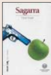
Sagarra David Urgull EDAF 246 orrialde 13,50 euro