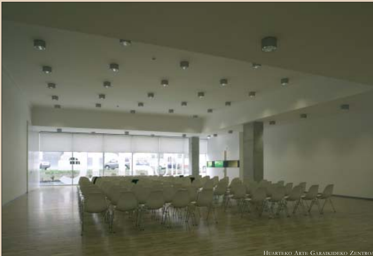
HUARTEKO ARTE GARAIKIDEKO ZENTROA

Jendaurreko ekitaldietarako prestatua dago eraikina.