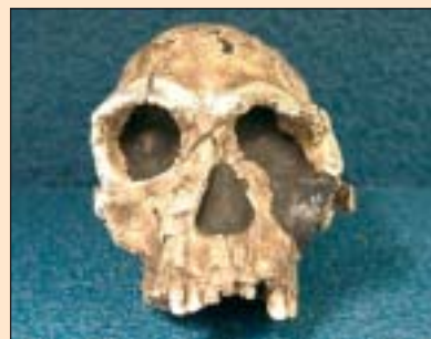
Homo habilis burezurra.

arrastorik “gazteena” da. Eta horrek esan nahiko luke Homo erectus ez litzatekeela habilis aren oinordeko izango, matrailezurra baino zaharragoak diren erectus arrastoak aurkitu baitira. Beste froga batzuek, ordea, berriro aurreko teoriara garamatzaite. Hortaz, ikerketan asko dago sakontzeko, testuliburuak aldatzen hasi baino lehen.