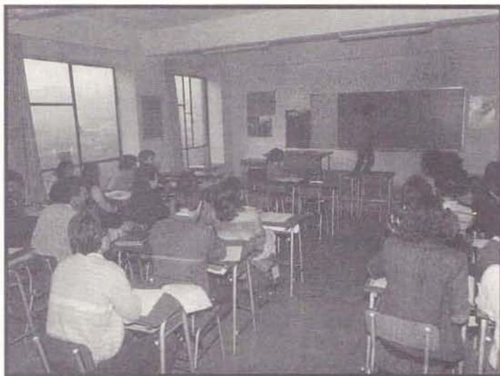
Hastapenetako alfabetatze klase bat.

da irakasleen formazioa: garai bateko biz-pahiru adituetatik sare zabal bat osatzera pasatu gara, irakasleek formazio plan sistematizatuetan partehartzen dute (informatikan, kudeaketan, metodologian, materialetan...). Oro har, euskaltegi bakoitzak bere formazio plana egiten du gaur egun, eta lehen ez zen egiten.