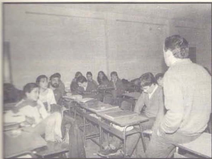
Lehen gramatika jorratzen zen batez ere.

da euskalduntze prozesua haurren esku geratuko dela; euskara etxean ikasi dugunok, beraz, sarritan pentsatzen dugu aski badakigula euskaraz eta, beraz, gure egitekoa ez dela euskararen mundu horretan sartzea. Alfabetatzearen gutxitzea, beraz, hortik etor daiteke. Bestetik, alfabetatu beharrekoak baino askoz gehiago dira euskaldundu beharrekoak. Zenbait funtzio frantsesa edo espainolarekin betetzera ohituta dago euskalduna, hori normalizat ikusten da eta ez da gabeziarik somatzen zenbait funtzio betetzeko.