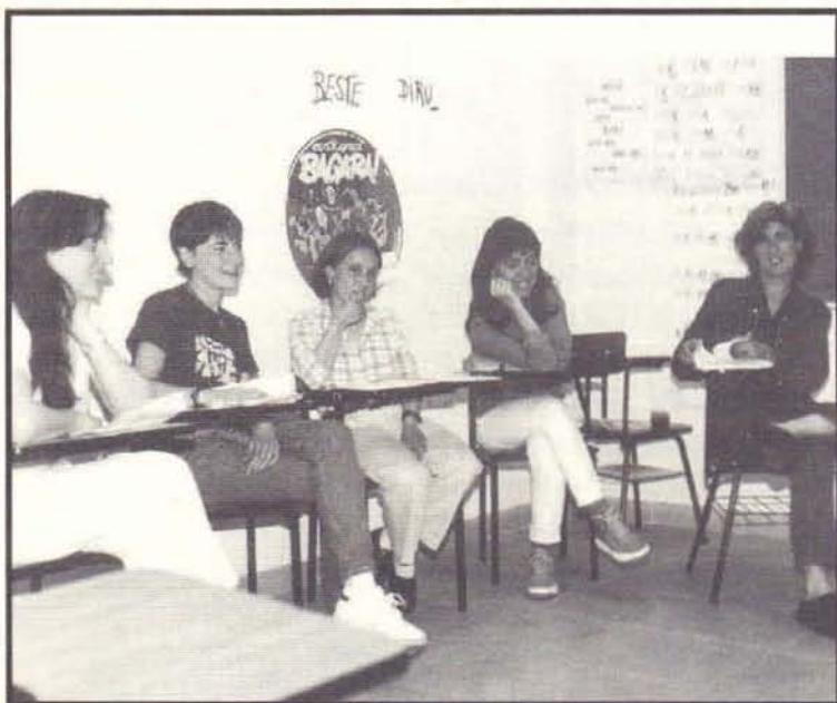
Ikasleak AEK-ko euskaltegi batean.

Hala eta guztiz ere badugu esperantzarako motiborik, adibidez, Bai Euskarari akordioak Iparraldean eman duena, batez ere euskalduntze-alfabetatze munduan. Administrazioaren aldetik izandako oztopoak, beraz, ez bakarrik gainditu, azpitik pasatzea ere espero dugu.