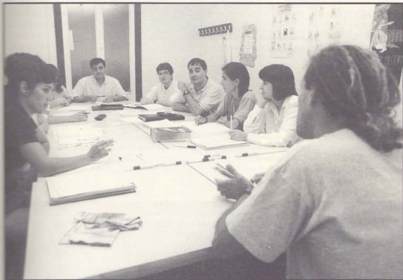
Gaur egungo ikasleak euskara ikasteko beste erabateko eskaera egiten ari dira.

zaren gutxitzea, beraz, hortik etor daiteke. Bestetik, alfabetatu beharrekoak baino askoz gehiago dira euskaldundu beharrekoak. Zenbait funtzio frantsesa edo espainolarekin betetzera ohituta dago euskalduna, hori normalizat ikusten da eta ez da gabeziarik somatzen zenbait funtzio betetzeko.